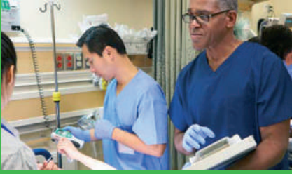
EcoStruxure Building Operation