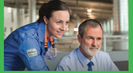
EcoXpert partner programını keşfedin