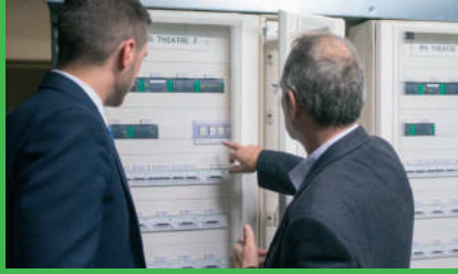
EcoStruxure Power Monitoring Expert